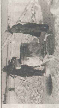
Tyska soldater hämtar upp vatten ur en finsk sjö vintern 1941.

Finland sluter fred med Sovjetunionen och förlorar Karelska näset, Viborg och Kexholm. Sovjetunionen får rätt att arrendera Hangö udd.