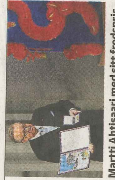
Martti Ahtisaari med sitt fredspris.