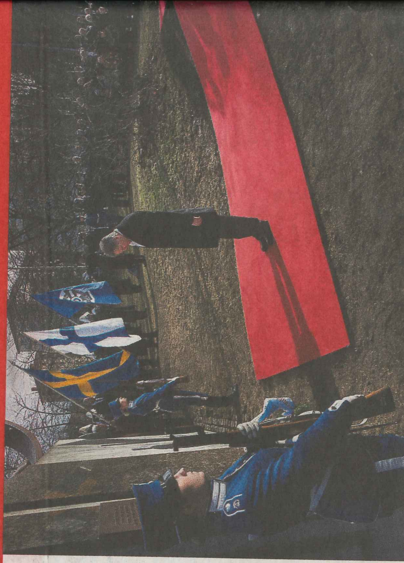
Finlands president Sauli Niinistö deltog i veckan vid en kransnedläggningsceremoni vid Finlandsmonumentet i Finlandsparken i Stockholm. Ceremonin arrangerades av Svenska Finlandsvrilligas minnesförening till minne av vinterkrigets slut. Kronprinsessan Victoria och prins Carl Philip deltog också.

garskap flera gånger. När jag frågar om det byter han från svenska till finska eftersom han i den här frågan vill uttrycka sig så exakt som möjligt.