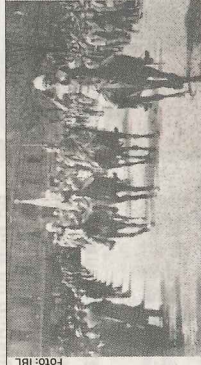
Marskalk Mannerheim i triumfgåget 1917 efter segern mot De röda.

Inbördeskrig mellan vita och röda. De vita får stöd av Tyskland, de röda av ryska bolsjevikregimen. De vita segrar.